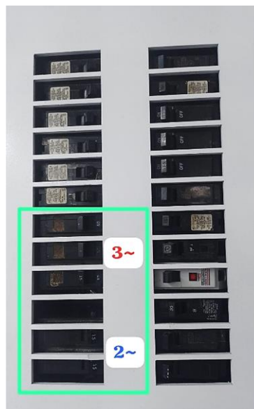
Figura 2. Tablero de distribución eléctrica (5 circuitos en la parte inferior izquierda)

Contiguo a los tableros del simulador (muro lateral a mano derecha) se encuentra instalado un tablero de distribución eléctrica y un interruptor general totalizador, conforme a los lineamientos del Reglamento Técnico de Instalaciones Eléctricas (RETIE). En este conjunto hay 24 interruptores para todos los circuitos del salón, deben identificarse claramente los interruptores automáticos de protección y maniobra destinados a la alimentación trifásica de 220 VCA y a la energización del servicio en sistema monofásico de 110 VCA. Identifique los 5 breakers debidamente rotulados y señalizados.