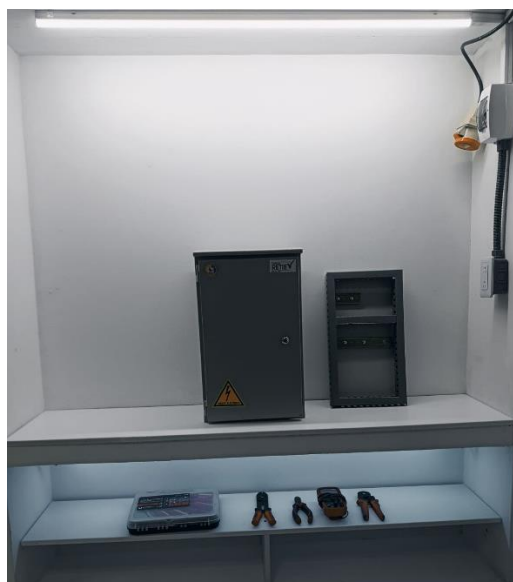
Figura 5. Organización del tablero y espacio de trabajo

El orden, la correcta manipulación y el cuidado de todos los elementos garantizan buenas prácticas operativas, preservan la integridad de los equipos y contribuyen a un ambiente de trabajo seguro. Realice aseo de la zona de trabajo antes de entregar al encargado o al instructor su área de trabajo.