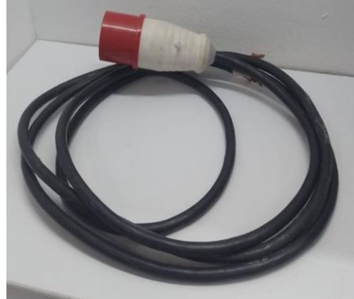
Figura 3. Sistema de conexión industrial trifásico y tierra

Alimentación trifásica. La alimentación trifásica se realiza mediante un conector industrial . Esta toma tiene empotrada en la pared lateral de cada tablero una base o conector hembra , y el complemento un enchufe o conector macho de 4 pines con el respectivo cable que debe conectar a un elemento de corte, totalizador o guardamotor.