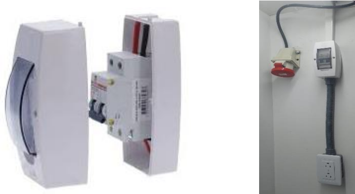
Figura 4. a) Sistema de conexión bifásico y neutro. b) Derivación monofásica