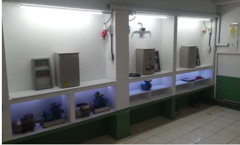
Figura 1. Simulador para el Diseño de Tableros de Control Industrial y Comercial

EQUIPO PEDAGÓGICO DE CENTRO MODELO PARA SISTEMATIZACIÓN DE PROYECTO PRESENTACIÓN DE PRODUCTOS TÉCNICO PEDAGÓGICOS