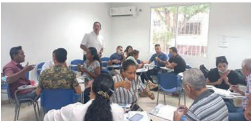
Figura 2. Profesión, Arte u Oficio