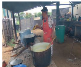
Figura 1. Wayuu: Friche